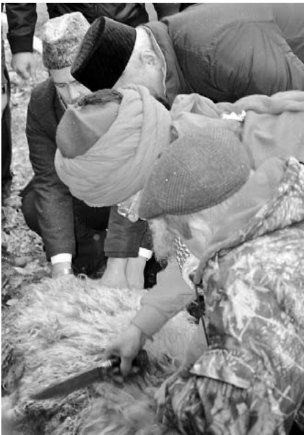
Продолжение темы, начало на с. 2-3

И откуда этот обряд? Ведь Всевышний Господь всех созданий – Аллах сам предупреждает в Коране: