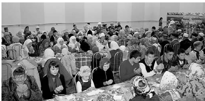
Праздничная проповедь имам-муктасиба с. Еркекеево (Еркекеевского района РБ)

Отдавая все силы укреплению могущества нашей великой державы на высшем государственном посту, он по праву снискал наше огромное уважение и признательность и заслуженно стал национальным лидером всего российско-