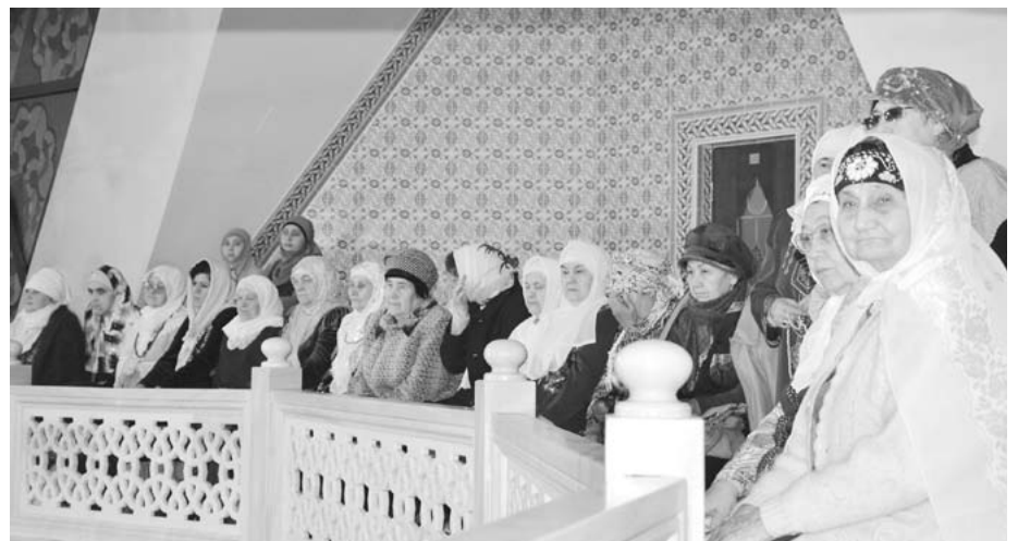
Продолжение темы на с. 30-32

Поэтому семья и есть первооснова всех народов и племен, стран и государств, всего человечества и его опора. А семья – это значит: семья раз «Я» – отец, мать и пятеро детей! А то как же? Тем более в нашей необъятной стране – России, где Господь Всемогущий собрал воедино более ста народов в единой семье! Родина наша огромна, Богом хранимая страна! Необъятны ее просторы, несметны ее богатства. Да и немало с возжелением, завистью и тоской зарящихся на них в этом мире.