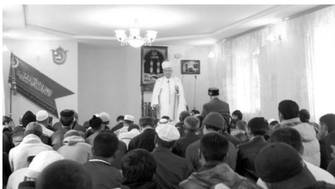
Курбан-байрам в мечети г. Мурома